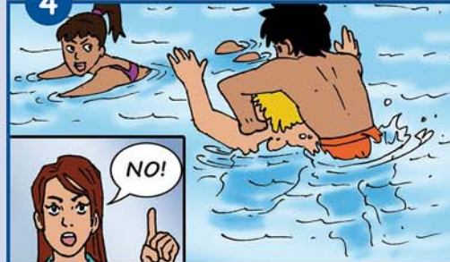
Andere nicht untertauchen!