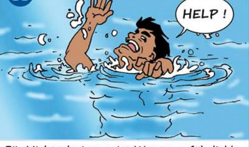
Für Nichtschwimmer ist Wasser gefährlich!