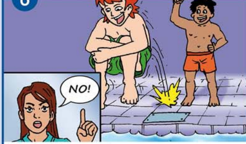
Nur ins Wasser springen, wenn es tief genug ist!