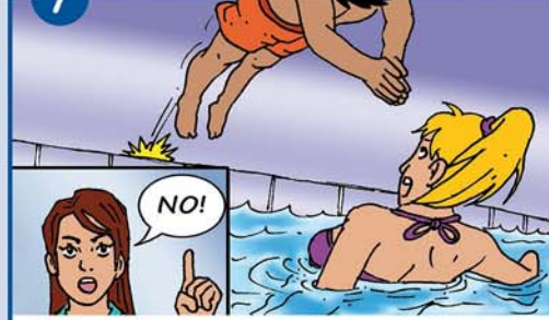
Nur ins Wasser springen, wenn es frei ist!