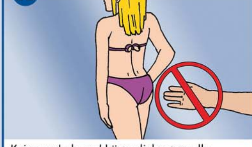
Keine verbale und körperliche sexuelle Belästigung gegenüber Frauen in jeglicher Bekleidung!