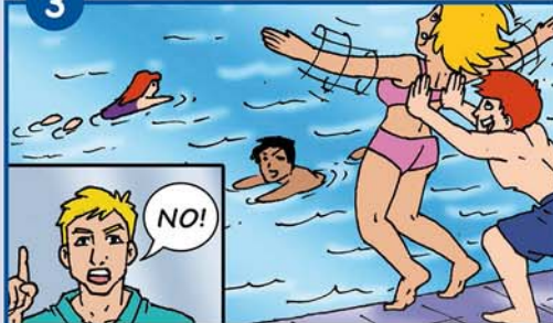
Andere nicht ins Wasser stoßen!