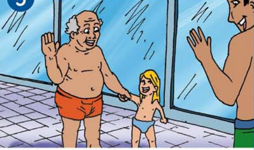
Rücksicht nehmen, besonders auf Kinder und ältere Menschen!