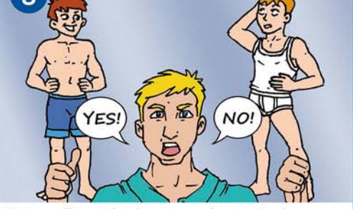
Keine Alltagskleidung im Schwimmbad. Badehose, Badeanzug oder Bikini aus schwimmtauglichen Materialien sind Pflicht!