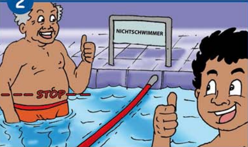
Nichtschwimmer müssen im Nichtschwimmerbereich bleiben und dürfen nur bis zum Bauch ins Wasser gehen!