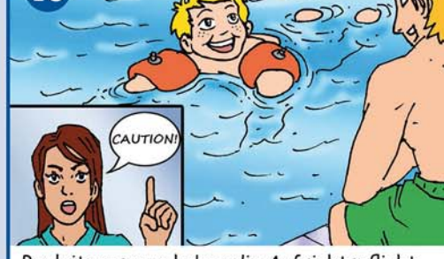
Begleitpersonen haben die Aufsichtspflicht für Kinder und müssen schwimmen können!