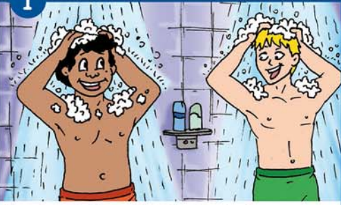
Vor dem Baden mit Seife duschen!