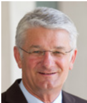
Theo Zellner Präsident des Bayerischen Roten Kreuzes

Wir hoffen, dass diese Broschüre geflüchteten Menschen, die traumatisiert sind, Unterstützung und Hilfe bietet.